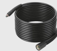
MANGUEIRA SEMI-RÍGIDO : FLEXÍVEL

Permite a formação de espuma, rotação de escovas e enxaguamento dentro das condutas.